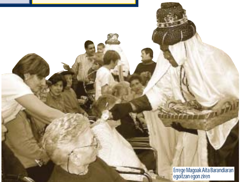
Errege Magoak Aita Barandiaran egoitzan egon ziren

Sin querer tirar balones fuera, a nuestro grupo nos gusta la seriedad y la responsabilidad pero, contamos con los medios económicos que tene-