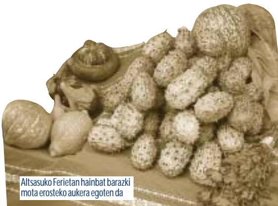
Altsasuko Ferietan hainbat barazki mota erosteko aukera egoten da

El sector primario se encuentra en una situación difícil apenas hay media docenas de explotaciones ganaderas en nuestro pueblo. Por eso desde el Ayuntamiento, en la medida que podamos, debemos apoyar a éste sector. Por otra parte, con la desaparición del ganado de nuestros montes, cada vez es más difícil el mantener los montes limpios. Por