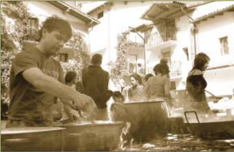
Urtero jai giro ezin hobean ospatzen da Altsasuko Gaztetxearen urtemuga