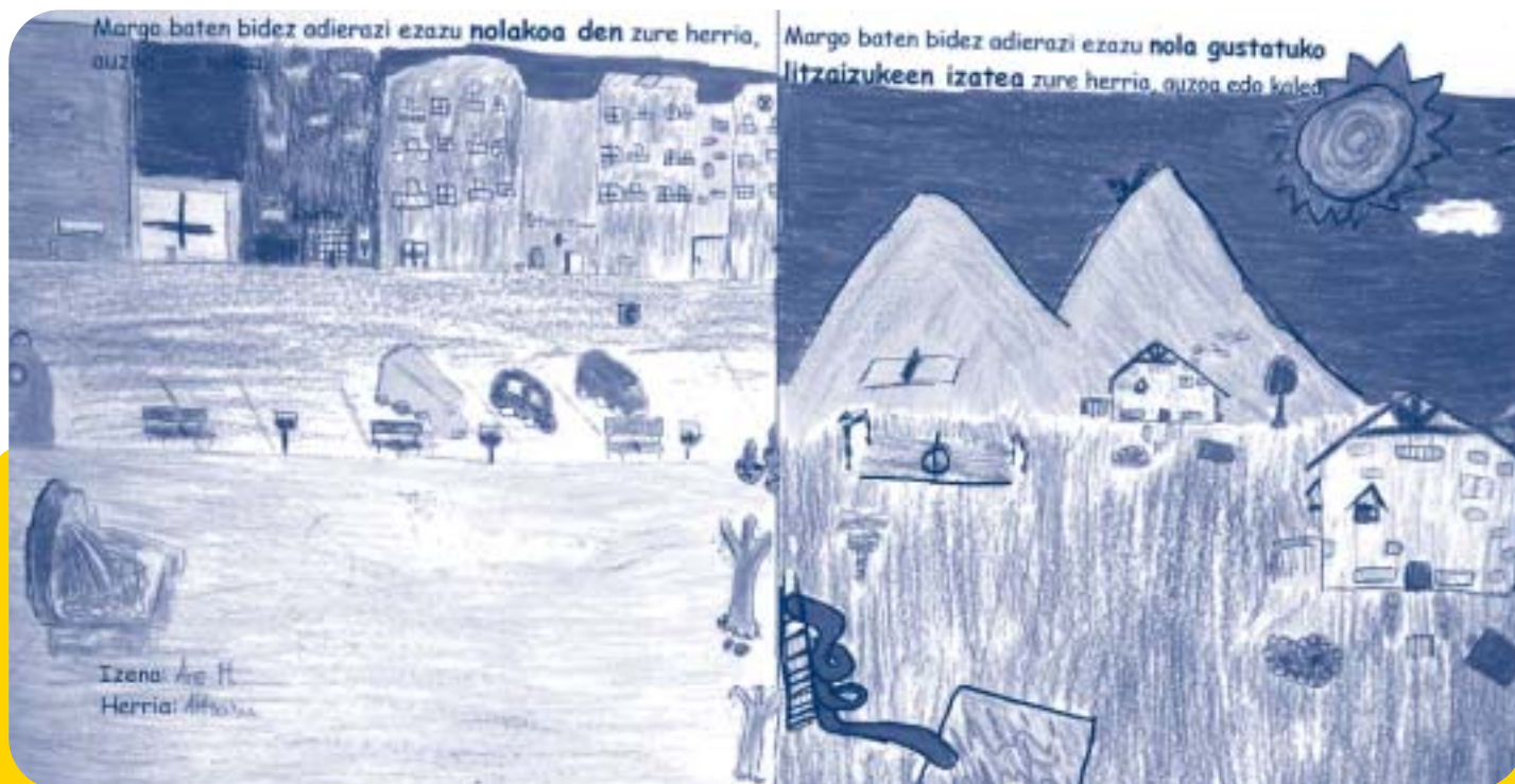
Marrazki lehiaketaren bitartez haurren nahia ezagutu dute antolatzaileek. Goian bi marrazki ageri dira: ezkerrekoan, herria nolakoa den adierazten duen marrazkian autoak ageri dira; eskubikoan, berriz, autoak desagertu eta berdegune eta aisaldi guneak nagusi ageri dira.