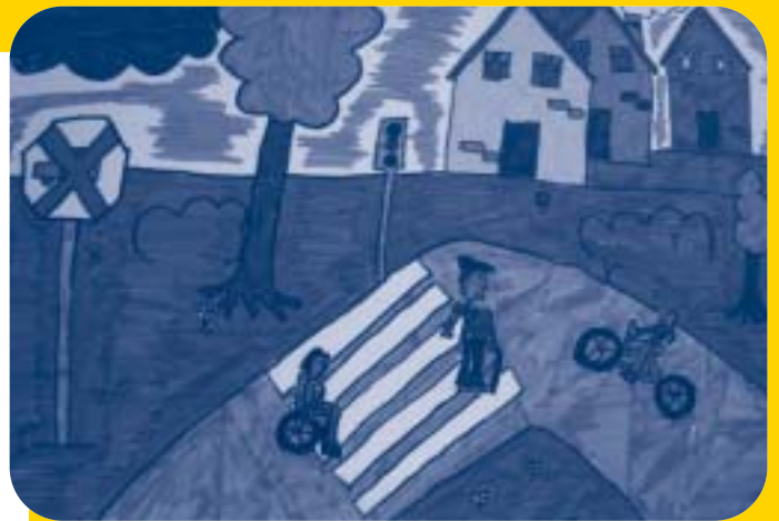
Según los dibujos, los escolares quieren menos coches y más zonas verdes y espacios de ocio.

Con el fin de recoger la opinión de la ciudadanía, el 15 de mayo tuvo lugar una jornada de reflexión sobre la accesibilidad en Alsasua, con la participación de grupos po-