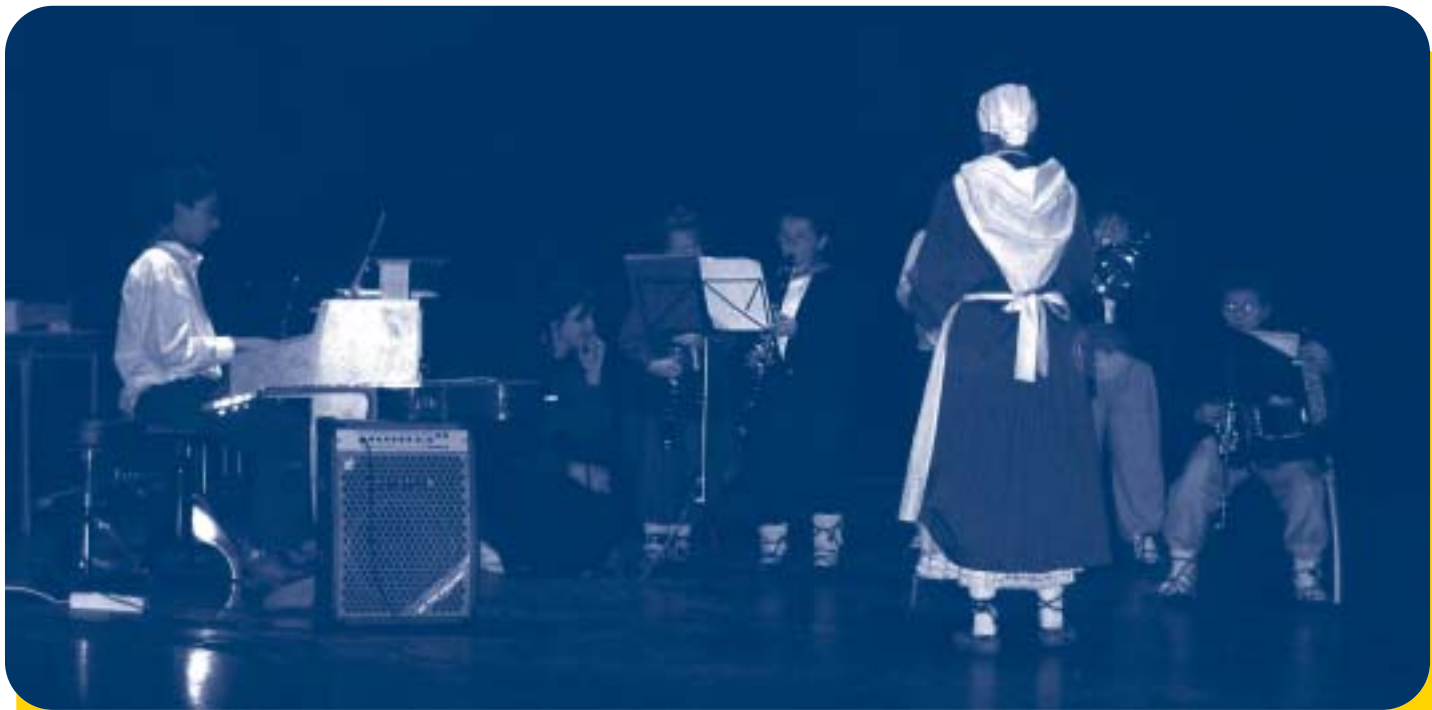
Musika Eskola berriak ondoko gela hauek izan beharko ditu, besteak beste: erabilera anitzeko bi gela handi (100 m 2 ), liburutegi-fonoteka bat (40 m 2 ), irakasle gela bat (30 m 2 ), banakako instrumentu klaseetarako 10 gela(15 m 2 ) eta ikasketa ez instrumentaletarako 4 gela (25 m 2 ).