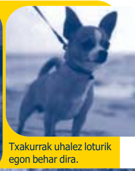
Txakurrak uhalez loturik egon behar dira.