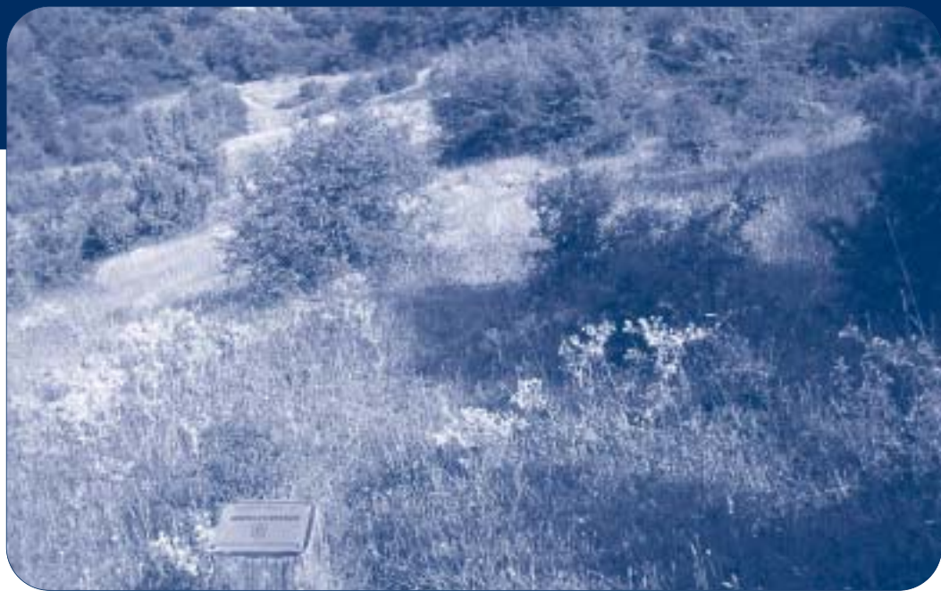
El trabajo de desbroce en Santaluziasakan se ha llevado a cabo durante la tercera semana de julio.

El próximo año pretenden seguir llevando a cabo más actuaciones: ejecución de una nueva pista forestal en Balankaleku y cierre del pastizal de Santaluziasakan.