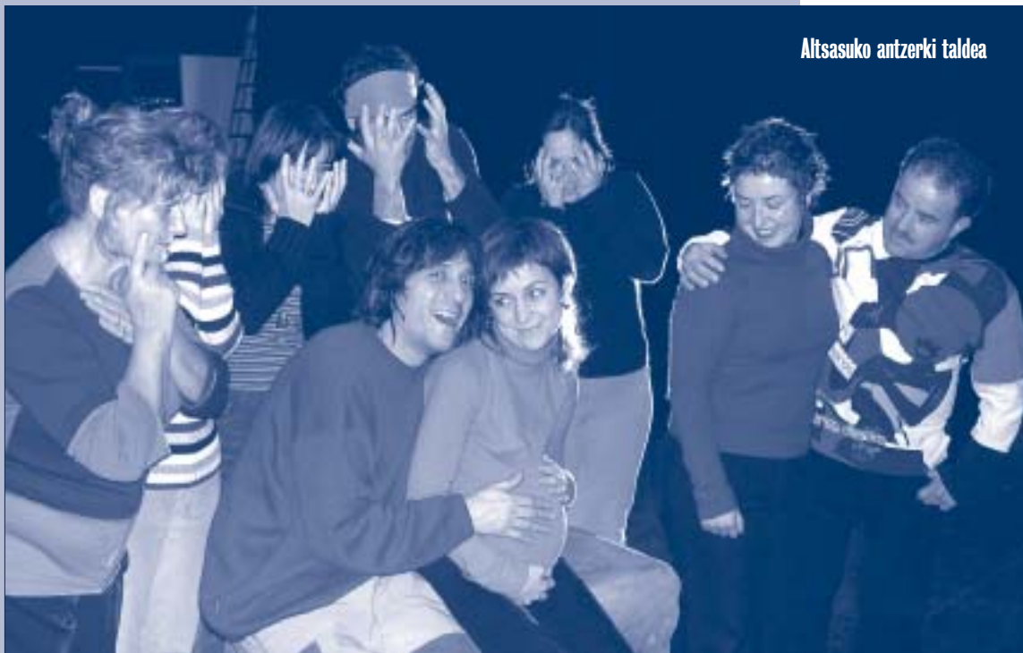
Altsasuko antzerki taldea