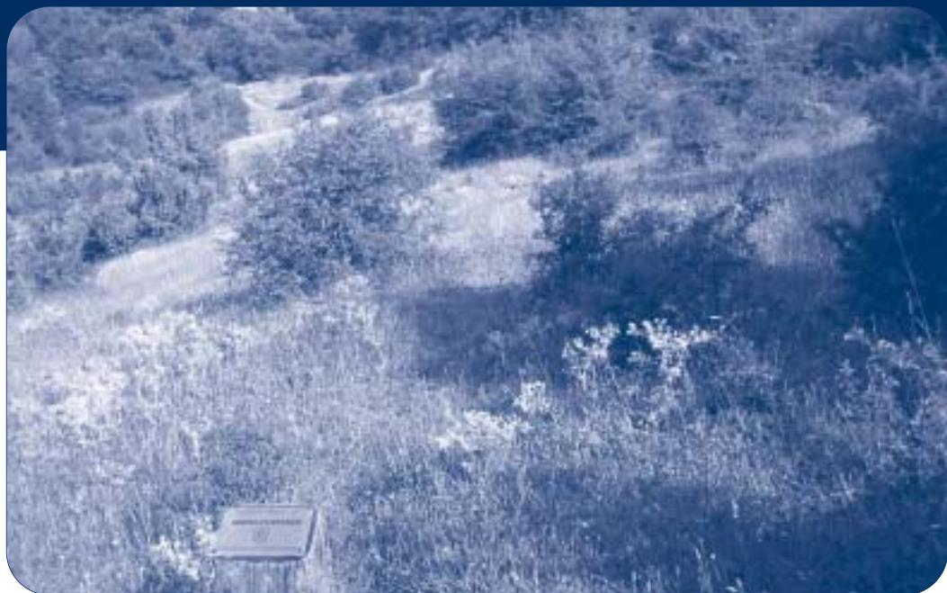
El trabajo de desbroce en Santaluziasakan se ha llevado a cabo durante la tercera semana de julio.

El próximo año pretenden seguir llevando a cabo más actuaciones: ejecución de una nueva pista forestal en Balankaleku y cierre del pastizal de Santaluziasakan.